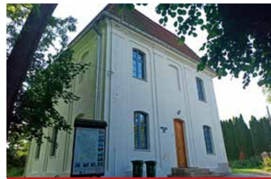
Dworek po renowacji zyskał nowy estetyczny wygląd.