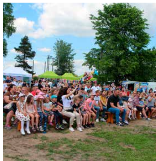
Występy artystyczne dzieci zgromadziły pod sceną liczną publiczność.

Zainteresowani mogli obejrzeć m.in. pokaz sprzętu służb mundurowych Komendy Miejskiej Policji w Białymstoku i Komisariatu Policji w Łapach, stoisko promocyjno-informacyjne Departamentu Zdrowia UMWP, pokaz akcji ratowniczo-gaśniczej OSP Turośń Kościelna czy skorzystać z kąpek