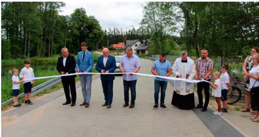
Uroczyste otwarcie ul. Chmielnej w Niewodnicy Kościelnej.

Także niewodniczanin nie krył zadowolenia z nowo wyremontowanej drogi, której pokonanie – szczególnie w czasie roztopów – sprawiało dużą trudność. Dzięki półtoramilionowemu dofinansowaniu z RFRD i środkom z budżetu gminy przebudowano kolidującą infrastrukturę techniczną, wykonano oświetlone przejście