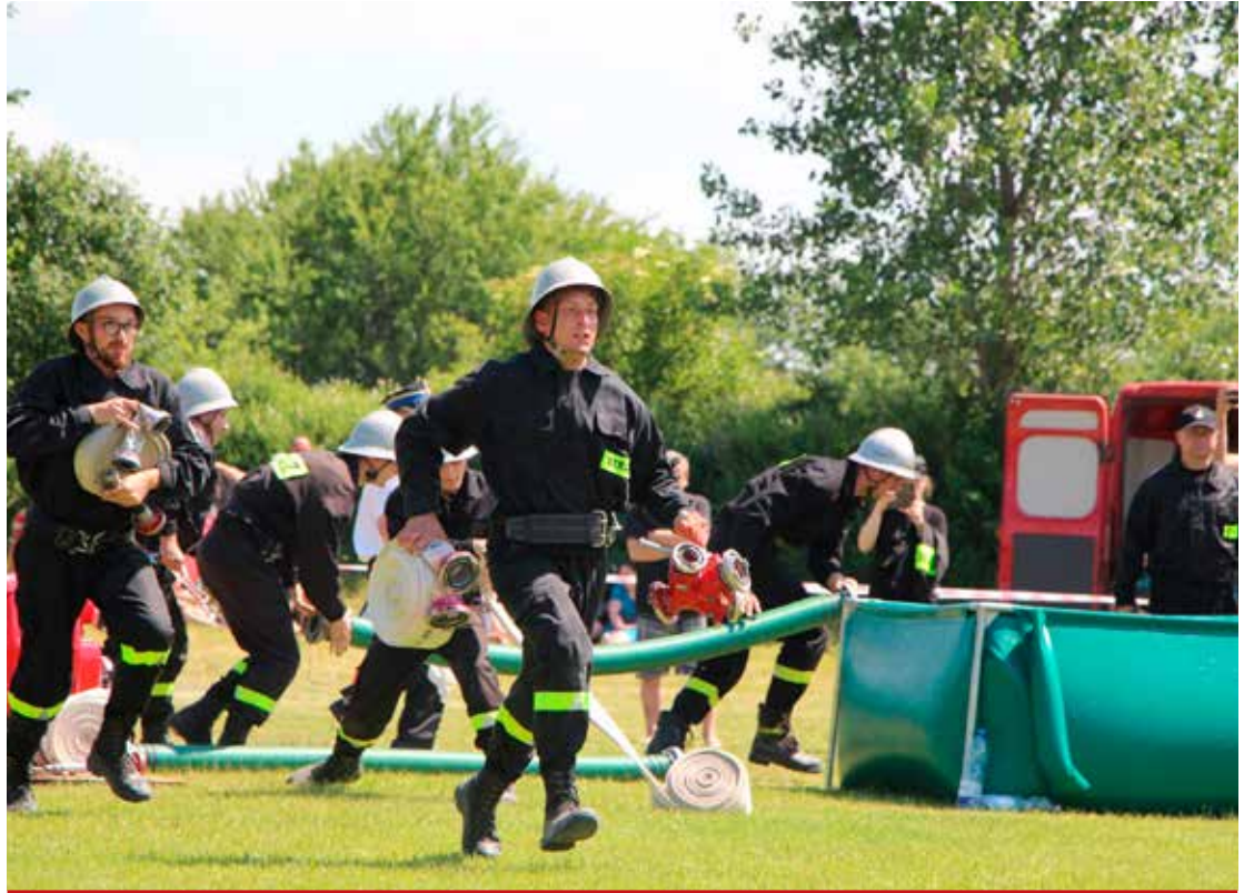
Już we wrześniu druhowie z Turośni Kościelnej zmierzają się w zawodach powiatowych. Życzymy powodzenia!

Klasyfikacja generalna zawodów przedstawia się następująco. Drużyny męskie: I miejsce – OSP Turośń Kościelna, II miejsce – OSP Chodory i III miejsce – OSP Turośń Dolna. Młodzieżowe Drużyny Pożarnicze: I miejsce – OSP Uhowo, II miejsce – OSP Chodory i III miejsce – OSP Łapy Dębowa. Drużyny kobiece: I miejsce – OSP Suraż, II miejsce – OSP Niewodnica Korycka i III miejsce – OSP Łupianka Stara.