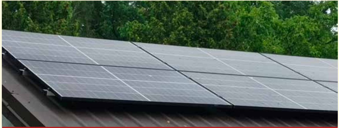
Mikroinstalacja fotowoltaiczna na dachu budynku jednorodzinnego.

Uwaga. W budynku mieszkalnym jednorodzinnym nie może znajdować się (również w okresie trwałości inwestycji) źródło ciepła na paliwo stałe.