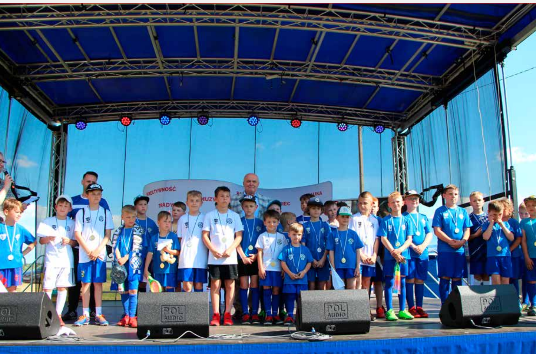
Dzień Dziecka z Turośnianką, s. 6