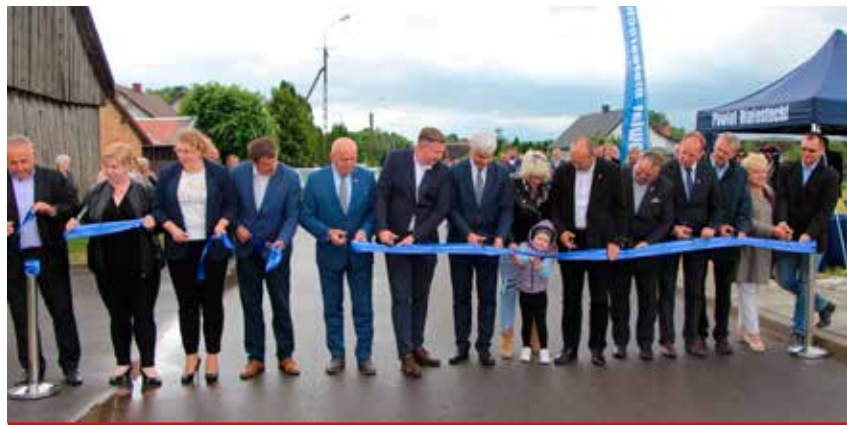
Oficjalne otwarcie drogi w Dołkach.

Zakończył się remont Dworku Myśliwskiego w Turośni Kościelnej