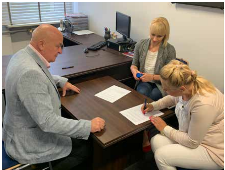
Umowę na realizację projektu pn. „Przyjazne Podlasie” podpisują Panie z KGW „Szlachcianki”.