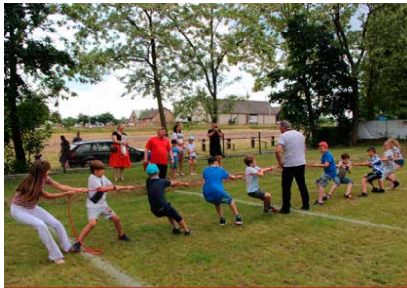
Najmłodszy zmierzali się m.in. w przeciąganiu liny.

Nie zabrakło atrakcji dla najmłodszych. Dzieci wybawiły się na dmuchańcach, z chęcią malowały twarze i aktywnie brały udział w animacjach. Na pikniku zagościły służby mundurowe z Komendy Wojewódzkiej Policji i Komendy Miejskiej Policji w Białymstoku oraz Komisariatu Policji w Łapach. Chętni korzystali z symulatora zderzenia czołowego, obejrzeni pokaz psów tropiących i poznali specyfikę policyjnej służby. Zainteresowani oglądali wozy ratowniczo-gaśnicze, osprzęt i odzież strażacką OSP Niewodnica Korycka i OSP Klepacze.