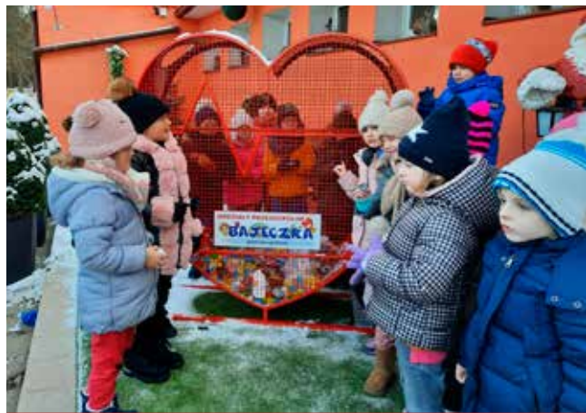
Jesteśmy przekonani, że do Świąt Bożego Narodzenia serce zapełni się po brzegi nakrętkami.

Ogólnopolska wymiana korespondencji w Szkole Podstawowej im. M. Konopnickiej w Turośni Dolnej