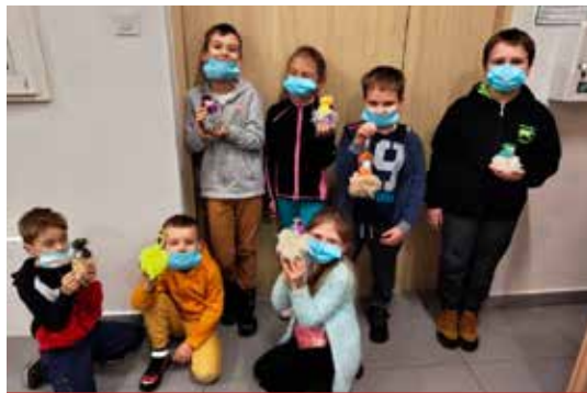
Na przedświątecznych zajęciach plastycznych dzieci wykonały piękne mikołaje ze sznurka bawełnianego.

Młodzi tancerze, pod czujnym okiem instruktorki, uczyli się m.in. różnych kroków i stylów tańca i pracy w grupie. Dzieci szlifowały swój talent artystyczny także podczas zajęć plastycznych. Plotły, malowały, wykładały. Na lekcjach śpiewu chętni dowiedzieli się, jak kontrolować oddech, ćwiczyli dykcję i operowanie głosem. Zwieńczeniem spotkań był występ świąteczny.