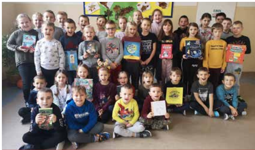
Czytanie ma moc! Po minach uczniów widać, że spotkania w bibliotece nastrajają pozytywnie.