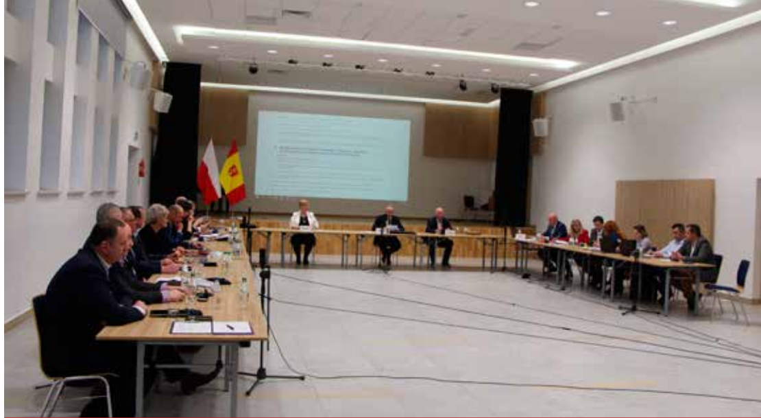
XXVIII sesja Rady Gminy Turośń Kościelna.