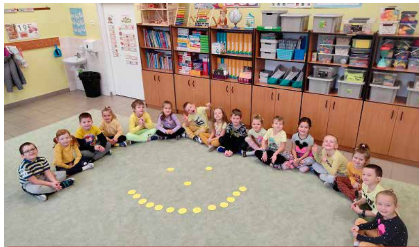
Piątek był dniem radości. Na zdjęciu dzieci z grupy przesyłają wszystkim moc uśmiechu!

Do szkoły wprowadzone zostało koło uczuć Kotlin Robbs, które pomogło dzieciom w nauce wyrażania podstawowych emocji i nazywania tych złożonych. Specjalnie na ten tydzień zostały przygotowane kody QR, które uczniowie wraz z wychowawcami skanowali i omawiali ukryte pod nimi