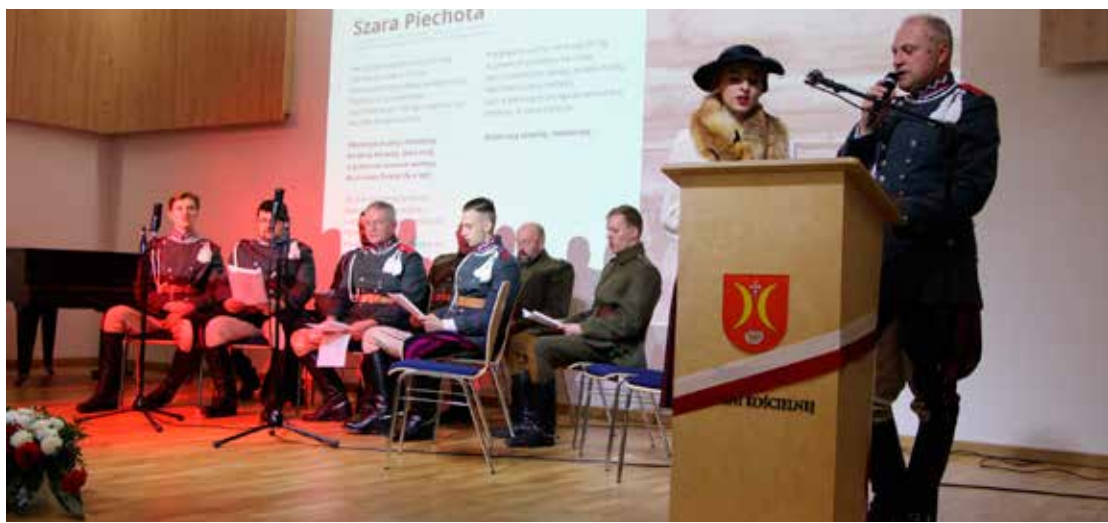
Tego wieczoru, piękna wojskowa historia przeplatała się ze wspólnym śpiewaniem pieśni patriotycznych.

Podsumowanie zajęć stałych Gminnego Ośrodka Kultury w Turośni Kościelnej