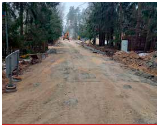
Trwają prace na ul. Myśliwskiej i Sosnowej w Niewodnicy Kościelnej.

Rok 2022 r. będzie obfitował również w inwestycje na drogach powiatowych. Przekazano już plac budowy w związku z przebudową drogi powiatowej w miejscowości Zawady. Rozpoczęto pierwsze etapy opracowywania dokumentacji na przebudowę z rozbudową drogi powiatowej Markowszczyzna – Turośń Kościelna. W planach jest opracowanie