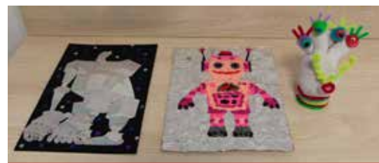
Prace laureatów konkursu. Od lewej: I miejsce, II miejsce i III miejsce.