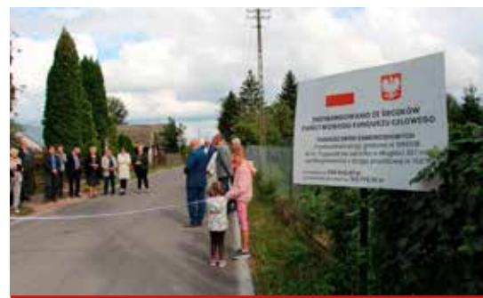
Analogicznie do lat ubiegłych, inwestycje drogowe były współfinansowane w ramach Rządowego Funduszu Rozwoju Dróg. Zdjęcie z otwarcia drogi w Trypuciach.

W 2021 r. na terenie gminy wykonano łącznie 2.925 mb sieci wodociągowej i 1.374 mb kanalizacji sanitarnej. Inwestycjami zostały objęte