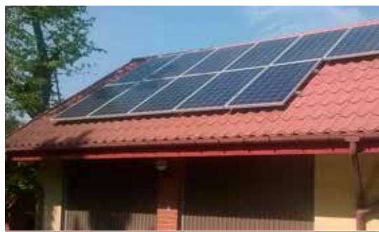
Chętnych do skorzystania z dotacji na OZE przybywa.

W 2021 r. wykonano prace związane z przebudową aż czterech dróg gminnych: ul. Polnej w Niewodnicy Kościelnej i dróg w Stoczkach, Trypuciach i Borowskich Żakach. Dotychczas gruntowe i wymagające stałych napraw jezdnie uzyskały nawierzchnię (w zależności od uwarunkowań tere-