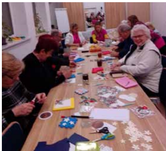
Seniorzy włożyli do skarpet piękne kartki świąteczne, wykonane na warsztatach, które prowadziły panie z KGW „Trzy Drogi” w Trypuściach.

Trwa ocena wniosków w Programach dotacyjnych Ministra Kultury i Dziedzictwa Narodowego