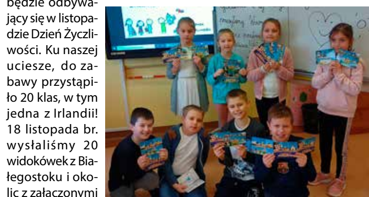
Dzieci samodzielnie zapisywały treść życzeń, przyklejały znaczki, zaklejały koperty i naklejały przygotowane przez wychowawczynię adresy. Co nas cieszy,