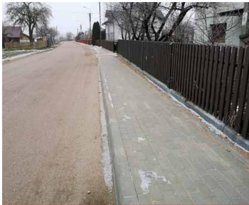
Wyremontowany chodnik w Borowskich Gzikach.