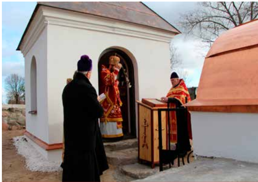
Odnowiony zabytek – świadectwo przestrzeni wieków, przez następne dziesięciolecia, wpisywać się będzie w krajobraz kulturowy gminy Turośń Kościelna.

Mieszkańcy korzystają z wyremontowanego, bezpiecznego chodnika