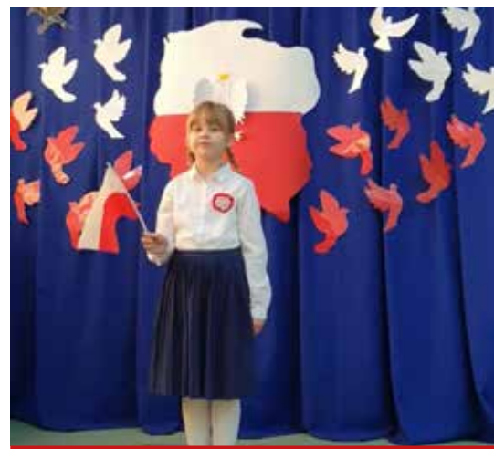
Ula zaśpiewała piosenkę „Czym jest Niepodległość”

Boże Narodzenie przypomina nam o tym, co w ludziach najpiękniejsze. Bogata polska tradycja pełna jest symboli. Opłatek, którym dzielimy się z bliźnimi to znak pojednania i przebaczenia. Zastawiony stół to symbol hojności i ofiarności. Żłóbek kieruje nasze myśli w stronę potrzebujących pomocy i opieki. Boże Narodzenie przypomina, że ludzie są dobrzy, gdyż Bóg przyjął ludzką naturę.