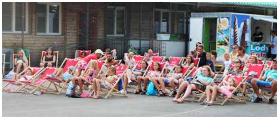
Spragnieni spotkań mieszkańcy licznie zgromadzili się na boisku przy ZS w Turośni Kościelnej.