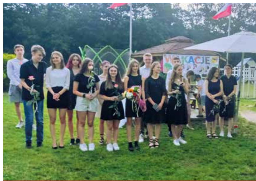
Zakończenie roku szkolnego to czas podsumowań całorocznej pracy, w tym wyników absolwentów, którzy na egzaminie ósmoklasisty uzyskali wspaniałe wyniki.

Podlaskie Kino Plenerowe zagościło w Turośni Kościelnej