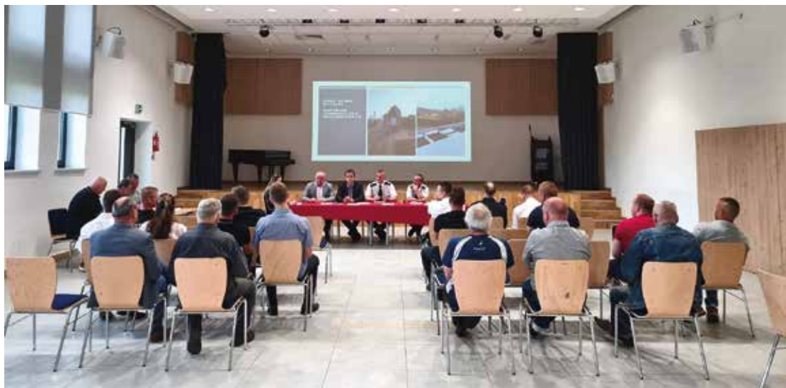
W posiedzeniach, oprócz członków OSP, brali udział przedstawiciele Zarządu Gminnego, Wójt Gminy Turośń Kościelna, radni i sołtysi oraz przedstawiciele Państwowej Straży Pożarnej w Białymstoku.

Praca ochotniczych straży jest nieoceniona, wymaga odwagi, chęci niesienia pomocy poszkodowanym i gotowości do działania w trudnych