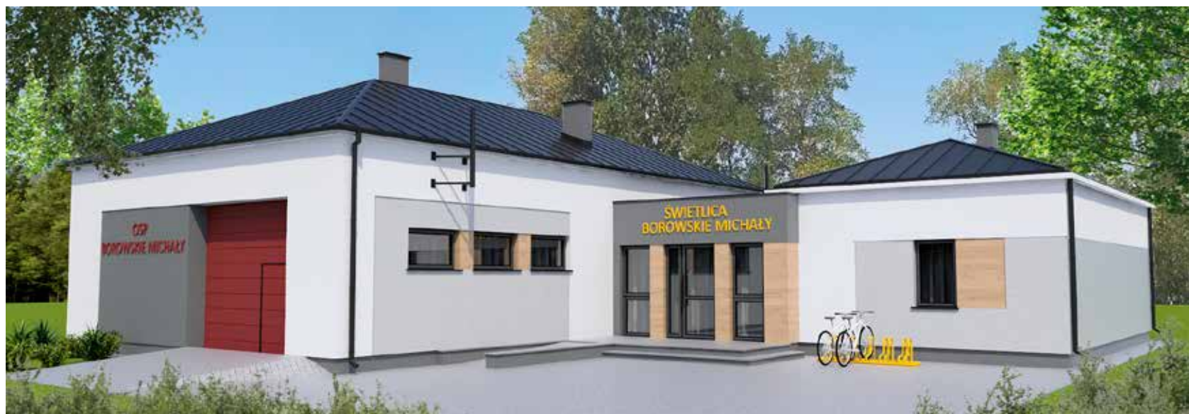
Wizualizacja świetlicy w Borowskich Michałach po rozbudowie.

ochotnicy zyskają, nie tylko niezbędne do funkcjonowania obiektu sanitariaty, ale także dodatkowe pomieszczenie do spotkań i pomieszczenia gospodarcze. Budynek zostanie też dostosowany do potrzeb osób niepełnosprawnych. Oddanie świetlicy do użytkowania planowane jest w listopadzie b.r.