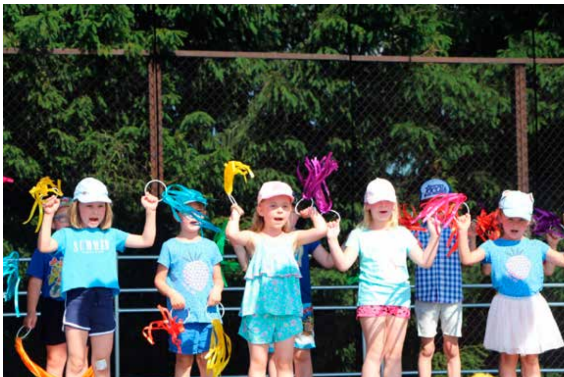
Nie tylko dorośli przygotowali piknikowe atrakcje. Grupa z Przedszkola Samorządowego w Turośni Kościelnej pokazała, jak wygląda zabawa! Gołym okiem widać, że przedszkolaki czują rytm i świetnie radzą sobie w grupowych tańcach.

Kadra wychowawców z Przedszkola Samorządowego w Turośni Kościelnej zadbała o dziecięcę stanowisko fryzjersko-kosmetyczne. Panie plótły piękne, kolorowe (i baaardzo modne) warkoczki i malowały dzieciom twarze. W tak słoneczny dzień świetnie sprawdziła się kurtyna wodna, przygotowana przez druhow z Ochotniczej Straży Pożarnej w Turośni Kościelnej. Strażacy udostępnili dzieciom sprzęt i ubrania ochronne. Zdjęciom w wozie strażackim nie było końca. Z pozytywnym odbiorem spotkał się także zorganizowany przez turosień-