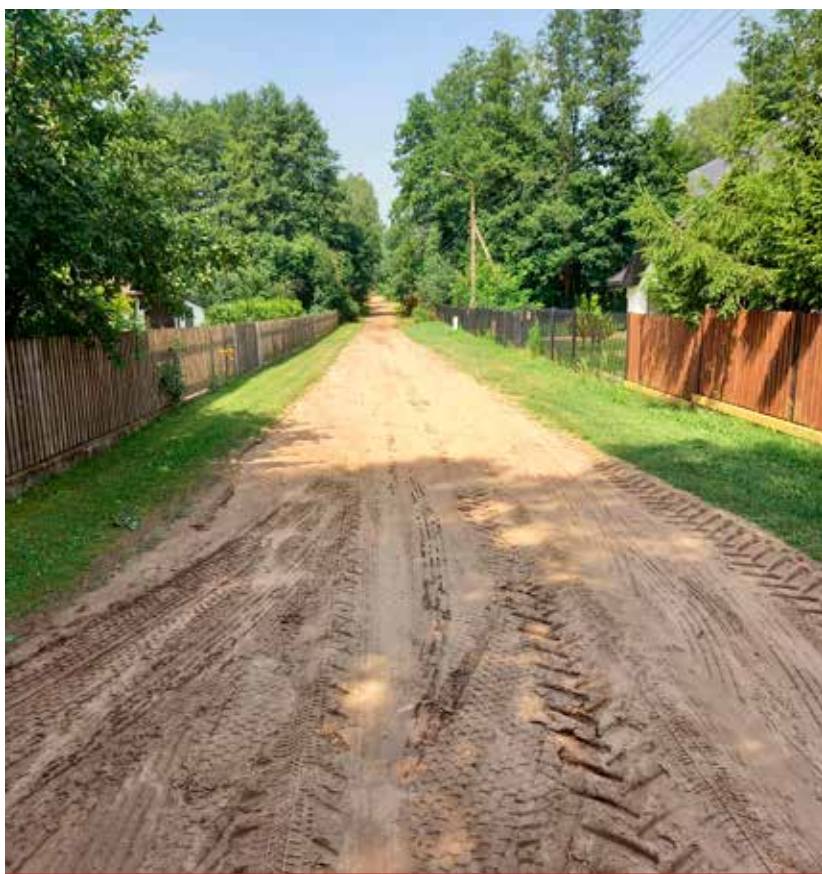
Przebudowa ul. Sosnowej w Niewodnicy Kościelnej planowana jest na 2022 r.

We współpracy z Powiatem Białostockim, w bieżącym roku budżetowym, przebudowano dwie drogi powiatowe w miejscowości Dołki i Bojary. Wartość inwestycji w Dołkach to 992 496,33 zł, z czego: RFRD – 441 998,33 zł, Powiat Białostocki – 275 249,00 zł, Gmina Turośń Kościelna – 275 249,00 zł. Wartość inwestycji w Bojarach to 1.506.015,19 zł, z czego: FDS – 679 688,09 zł, Powiat Białostocki – 413 163,55 zł, Gmina Turośń Kościelna – 413 163,55 zł.