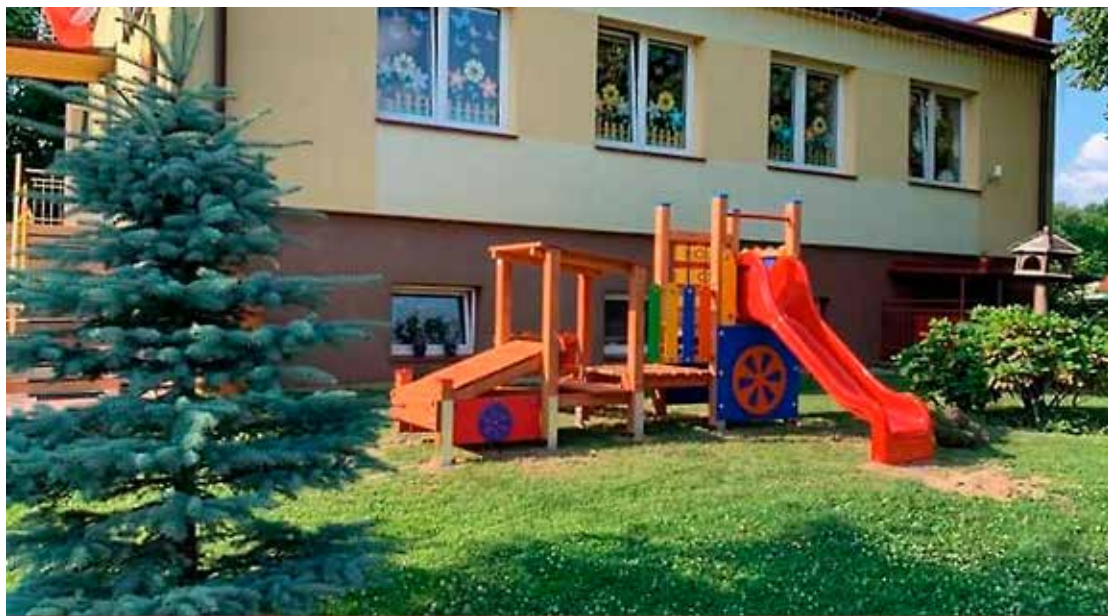
Na placu stanęło auto ze zjeżdżalnią.

Nowy plac zabaw przy Przedszkolu Niepublicznym „Puchatek” w Niewodnicy Kościelnej