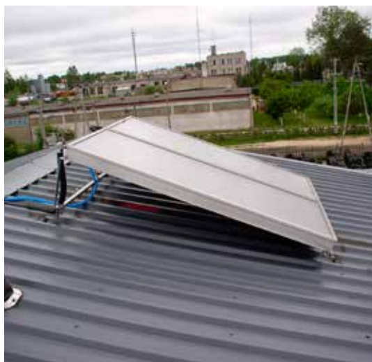
Gmina Turośń Kościelna czeka na rozstrzygnięcie naboru na dofinansowanie instalacji OZE.

Wkrótce dowiemy się, czy Gmina Turośń Kościelna uzyska wsparcie na montaż odnawialnych źródeł energii dla mieszkańców. Na ostatniej prostej jest ocena złożonych do Urzędu Marszałkowskiego Województwa Podlaskiego wniosków