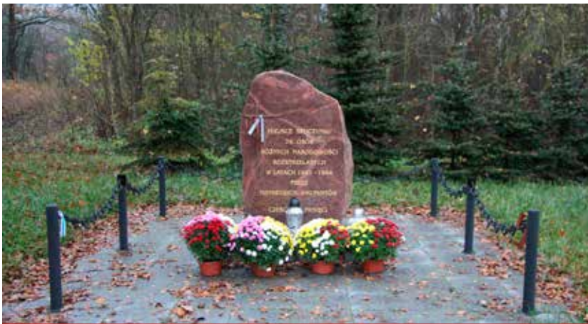
Piękne, kolorowe chryzantemy ozdobią miejsca pamięci, m.in. w Juraszkach (na zdjęciu), Niewodnicy Kościelnej, Borowskich Gzikach i Turośni Kościelnej.

Gmina Turośń Kościelna pomaga przedsiębiorcom