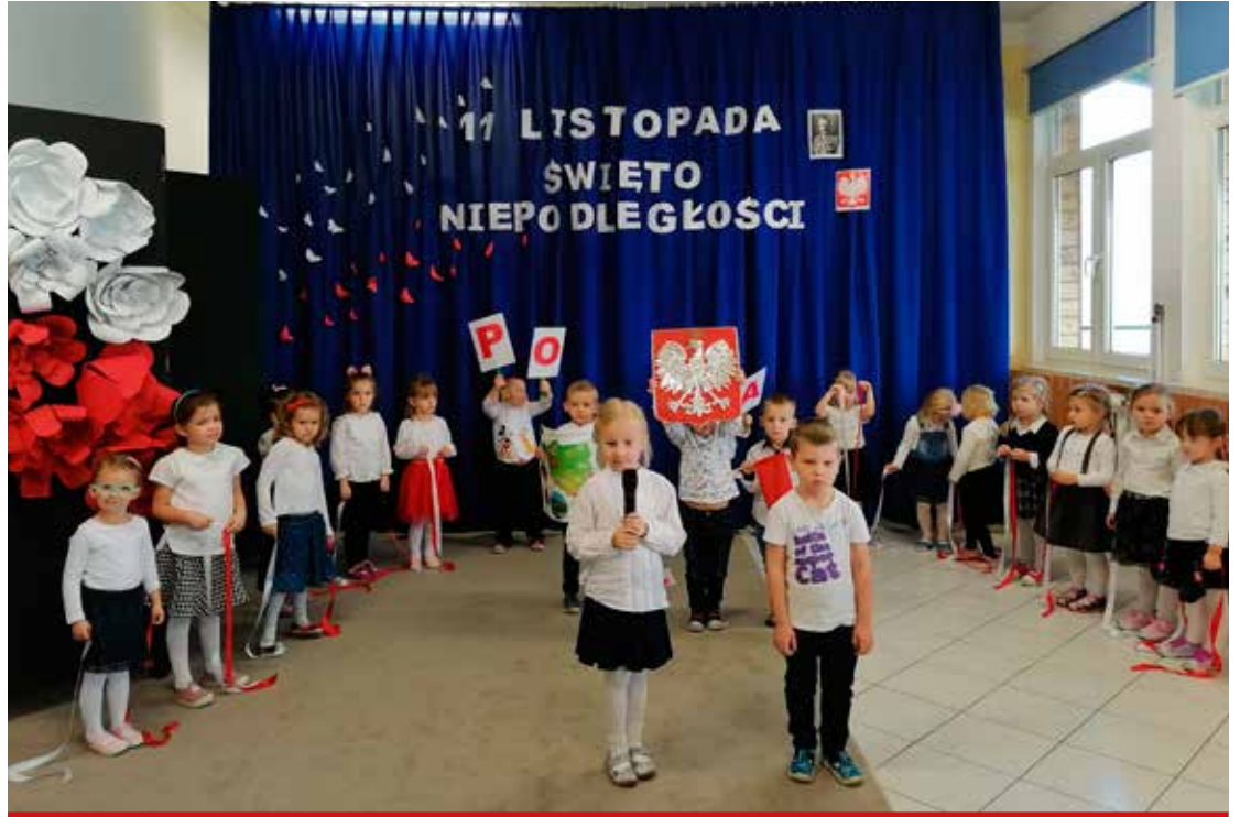
Każda z przedszkolnych grup przygotowała inscenizację z okazji Narodowego Święta Niepodległości. Na zdjęciu dzieci z grupy „Gwiazdeczki”.

Kolejne miesiące realizacji projektu przyniosą ciekawe doświadczenia. W styczniu wykonamy regionalną potrawę według przepisu babci.