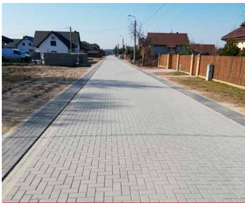
Od maja mieszkańcy Niewodnicy Koryckiej mogą korzystać z wyremontowanej ul. Piaskowej.

W jego wyniku, m.in. w pięciu świetlicach wiejskich zostały zainstalowane pompy ciepła. Kolejnym etapem było zrealizowane w br. zadanie, w ramach którego zostały odnowione ostatnie cztery świetlice oraz siedziby OSP w: Iwanówce, Chodorach, Borowskich Michałach i Borowskich Ciborach. Zakres prac obejmował m.in. docieplenie stropodachu wraz z wymianą poszycia dachowego, docieplenie ścian zewnętrznych, istniejących kominów i podłóg, wymianę stolarki drzwiowej i okiennej zewnętrznej i wewnętrznej, wymianę instalacji elektrycznej i wymianę oświetlenia na energooszczędne, wykonanie instalacji c.w.u., c.o. i rekuperacji oraz remont pomieszczeń wewnątrz budynków. Przeprowadzone inwestycje wpłyną na zwiększenie efektywności energetycznej budynków, zmniejszeniu ulegnie zapotrzebowanie i zużycie energii cieplnej. Realizacja inwestycji była możliwa przy wsparciu środków z Regionalnego Programu Operacyjnego Województwa Podlaskiego na lata 2014-2020. Całkowita wartość wyniosła: 2.767.500 zł, natomiast dofinansowanie: 895.530,90 zł.