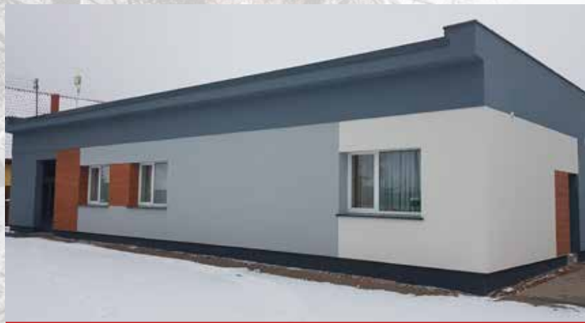
Dzięki remontowi elewacji świetlica w Czaczkach Wielkich zyskała nowy, estetyczny wygląd.

Mając na uwadze wszystkie wnioski i potrzeby składane przez mieszkańców gminy nagrodę – dofinansowanie w kwocie 50 000 zł Gmina przeznaczyła na doposażenie lub remont ośmiu świetlic wiejskich. Największym