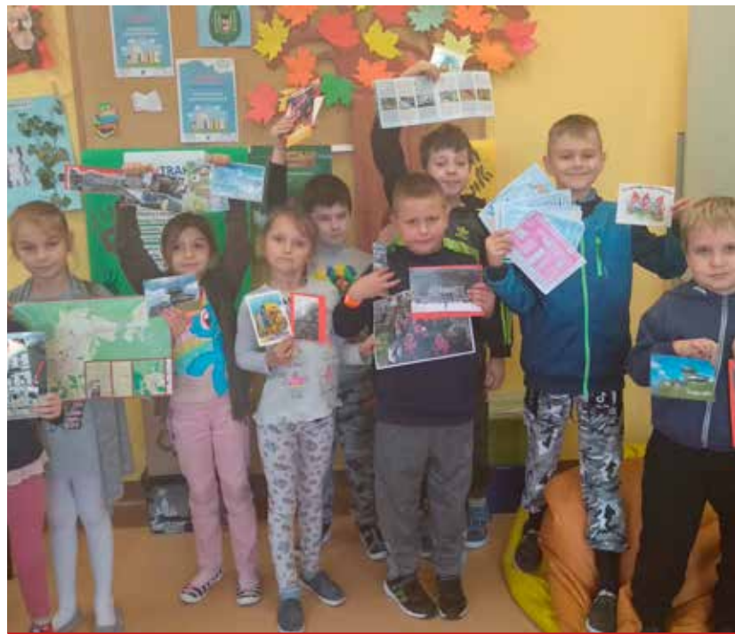
Uczniowie klasy II otrzymali pocztówki oraz mnóstwo folderów, mapek i zdjęć Kowar. Jak się okazało, jest to miejscowość turystyczna leżąca tuż przy Karpaczu.

Uczennica SP w Turośni Dolnej nagrodzona w konkursie poetyckim