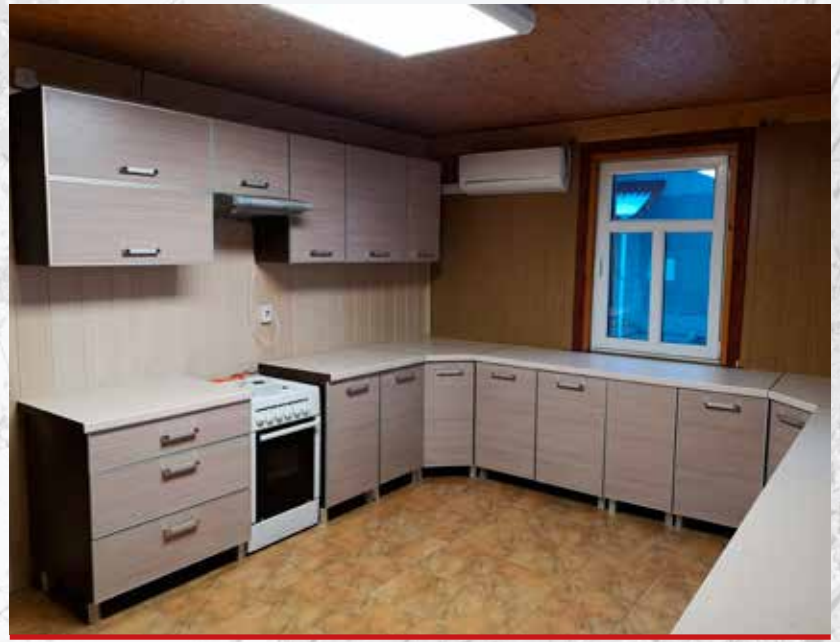
Tak, po remoncie, prezentuje się kucha świetlicy wiejskiej w Baciutach.

przedsięwzięciem zrealizowanym dzięki nagrodzie był remont sali głównej w niewodnickiej świetlicy, polegający na przebudowie konstrukcji sufitu, w celu poprawy akustyki. W ramach dotacji do świetlicy w Barszczówce, Baciutach i Trypuciach zakupione zostały zestawy nagłaśniające. Świetlica w Czaczkach Wielkich zyskała nową elewację, do świetlicy w Chodorach zakupiono stojak rowerowy, do Pomigacz firany. Świetlica w Trypuciach została doposażona także w zmywarkę, w świetlicy w Baciutach wyremontowano kuchnię, a do Topilca zakupiono kolumnę aktywną, projektor i ekran.