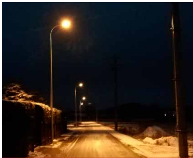
Na części ul. Strażackiej w Turośni Kościelnej zamontowano nowe lampy.

Ponadto w 2020 r. Powiat Białostocki rozpoczął przebudowę z rozbudową drogi powiatowej nr 1543B (ul. Topole) w Niewodnicy Kościelnej na odcinku od ul. Dąbrowskiego do ul. Trakt Napoleoński ze zjazdami z budową i przebudową infrastruktury technicznej. W wyniku zrealizowanej inwestycji, która ostatecznie zostanie ukończona w 2021 r., jezdnie już ma nawierzchnię z betonu asfaltowego, zaś chodniki będą wykonane z kostki betonowej. Ww. zadanie zostało wykonane przy wkładzie zarówno Powiatu, jak i Gminy, zgodnie z przyjętą zasadą o współfinansowaniu inwestycji w zakresie dróg powiatowych (50/50%) oraz dodatkowo z budżetu państwa.