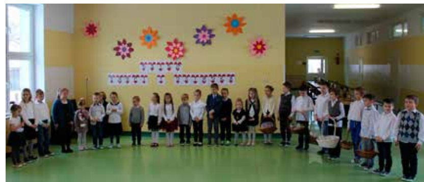
Dzieci włożyły dużo pracy, aby jak najlepiej podziękować swoim dziadkom za miłość i codzienną troskę.

Elżbieta Puścian