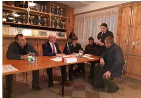
Zebranie walne OSP w Chodorach.

Paweł Kondracki