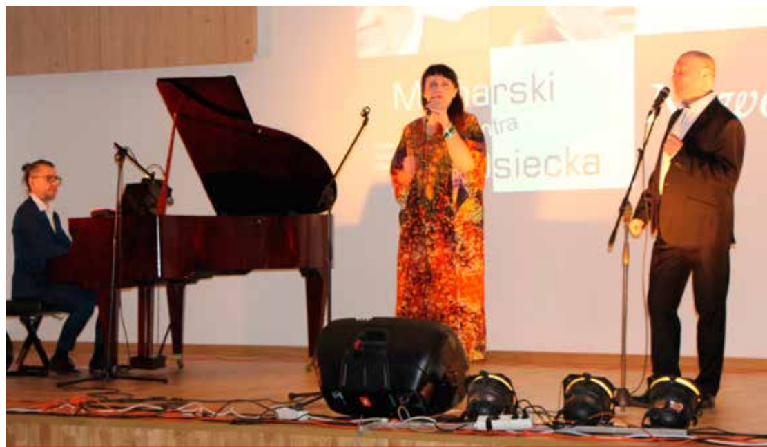
Artyści zaprezentowali twórczość Agnieszki Osieckiej i Wojciecha Młynarskiego