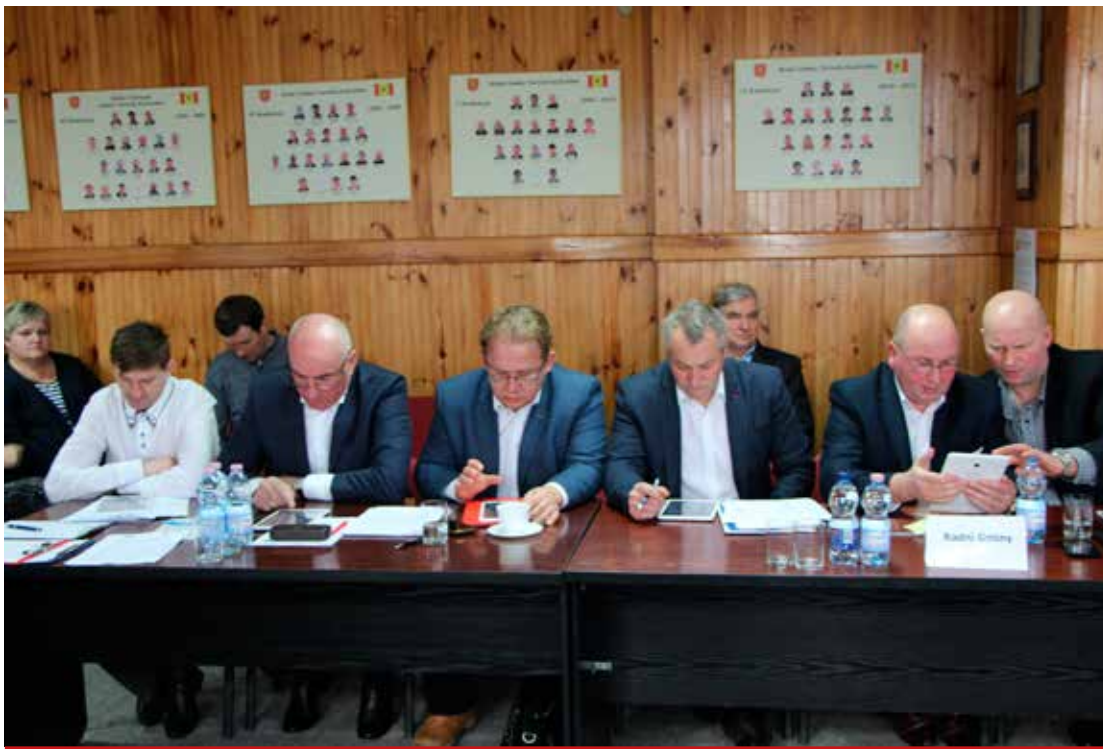
Nowe technologie umożliwiają sprawniejsze przeprowadzenie głosowania.

nizacja studni w Baciutach” oraz zwiększono plan dochodów o 177.000 zł na zadanie realizowane w 2018 r. „Zagospodarowanie działek gminnych na cele sportowo-turystyczne”. Konsekwencją dokonanych zmian w budżecie gminy była zmiana Wieloletniej Prognozy Finansowej Gminy na lata 2018-2019.