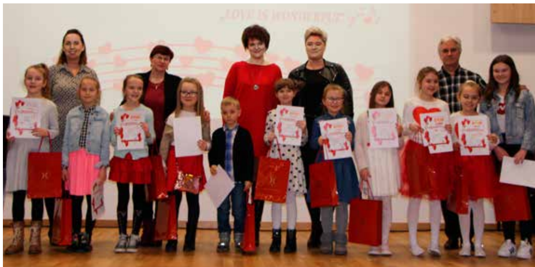
Laureaci V Przeglądu Piosenki Walentynkowej wraz z Jury oraz organizatorami konkursu.

W piątej już edycji konkursu udział wzięło 28 wykonawców. Przegląd rozpoczął się występami najmłodszych uczestników: grupy przedszkolaków i zerówkowiczów. Dzieci śpiewały o miłości do mamy, o tej, która nie wypali się „kiedy mocno zawieje wiatr” a także o tej niespełnionej. Na widowni licznie zgromadziły się rodziny solistów. Co ciekawe, w V Przeglądzie wystąpiły aż trzy duety wokalne. Na przekór panującej za oknem aurze dwukrotnie usłyszeliśmy „Tyle słońca w całym mieście” Anny Jantar. Niektórzy uczestnicy urozmaicili swój występ grą na instrumentach – mogliśmy posłuchać na żywo dźwięków gitary, czy ukulele. Ostatni głos na scenie miała najstarsza grupa wykonawców – młodzież w wieku 11-13 lat.