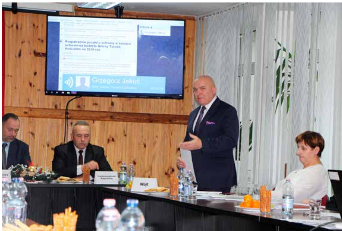
Głównym tematem ostatniej w 2018 r. sesji Rady Gminy było uchwalenie budżetu na bieżący rok.

Redakcja zastrzega sobie prawo do skracania i adiustacji nadesłanych tekstów. Przedruki i wykorzystywanie opublikowanych materiałów mogą się odbywać wyłącznie za zgodą redakcji.