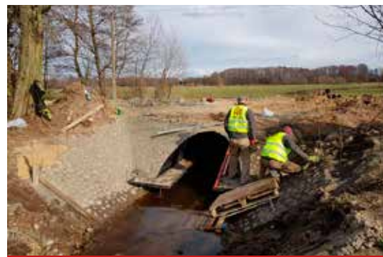
Roboty budowlane związane z budową przepustu w ciągu drogi w Czaczkach Wielkich.