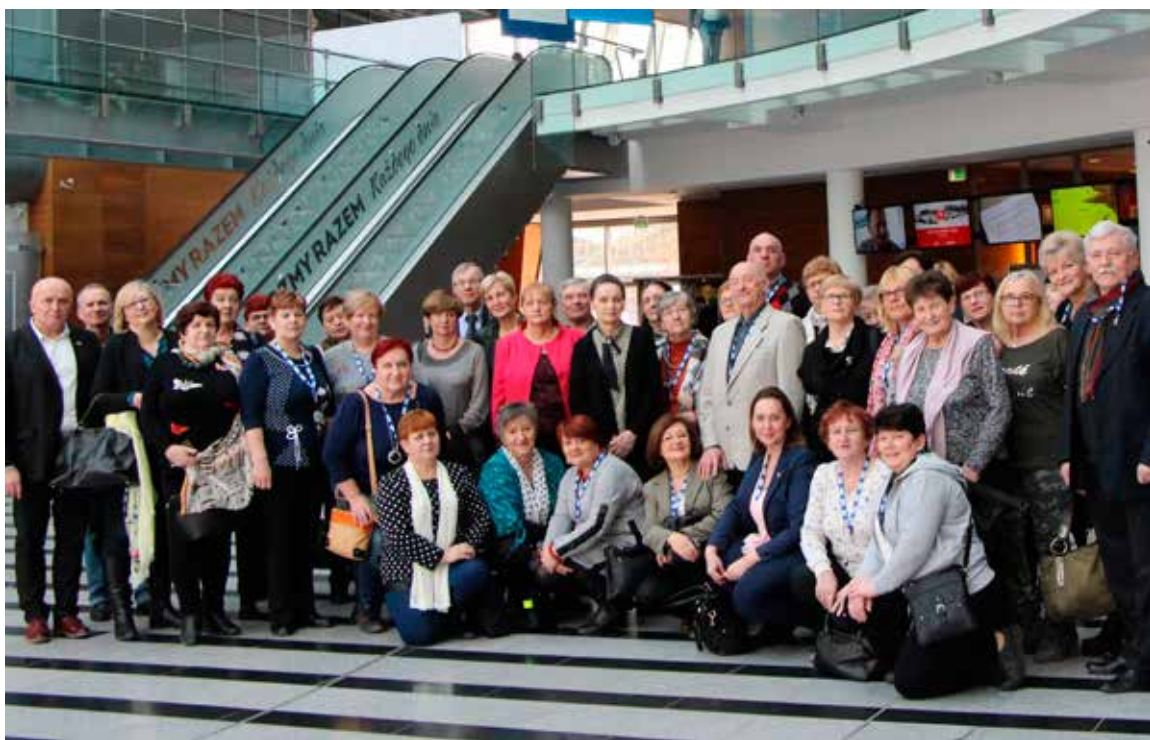
Uczestnicy wycieczki w gmachu Telewizji Polskiej.

Agnieszka Danilczuk