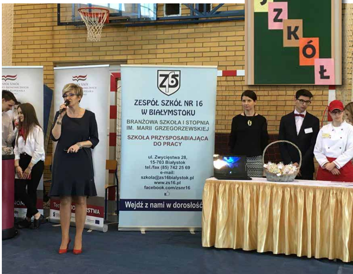
Nieuchronnie zbliża się moment podjęcia ważnych decyzji przez najstarszych uczniów Zespołu Szkół w Turośni Kościelnej. Przed gimnazjalistami klas III i ósmoklasistami podstawówek ważny i trudny wybór kolejnego etapu edukacji.

Grażyna Dryl