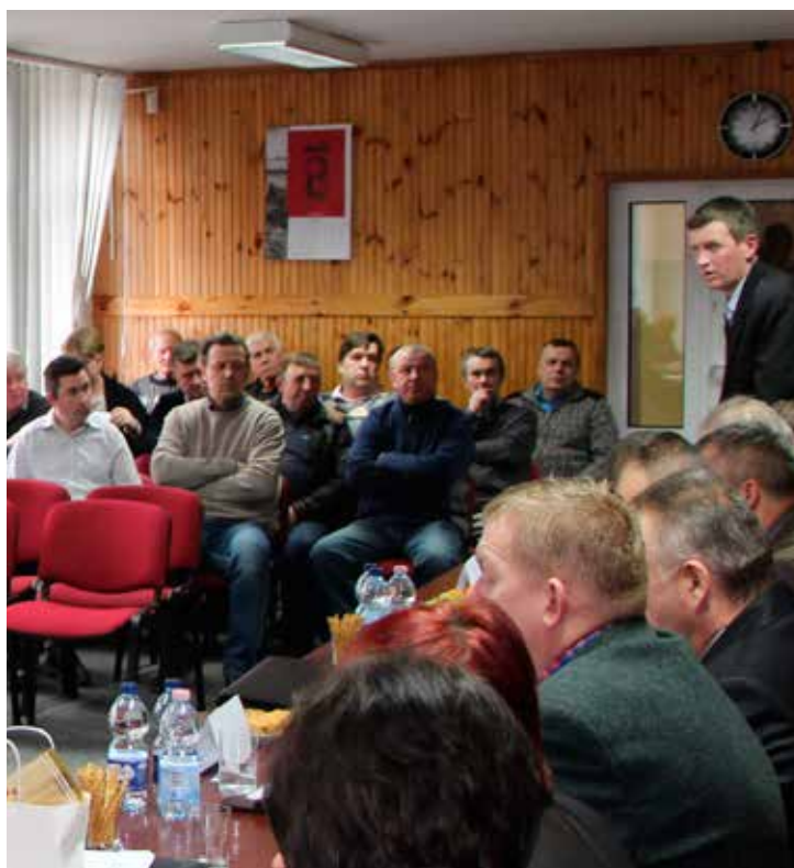
Zgłaszane interpelacje i wnioski często dotyczą poprawy nawierzchni dróg i bezpieczeństwa na drogach.

Rada Gminy przyjęła uchwałę w sprawie określenia Programu opieki nad zwierzętami bezdomnymi oraz zapobiegania bezdomności zwierząt w 2018 roku. Program ma zastosowanie w stosunku do bezdomnych zwierząt przebywających na terenie gminy Turośń Kościelna, w tym w szczególności do bezdomnych psów i wolno żyjących kotów. Szczególne działania realizowane przez Gminę w zakresie przeciwdziałania bezdomności zwierząt obejmują: odławianie i umieszczanie w schronisku – na zgłoszenie mieszkańców, organizacji społecznych i służb publicznych.