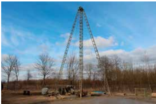
Wiercenie studni głębinowej na hydroforni w Baciutach.

Na ukończeniu są prace związane z budową ujęcia wody na zmodernizowanej w 2014 r. stacji uzdatniania wody w Baciutach. Dzięki wybudowanej studni poprawi się przede wszystkim bezpieczeństwo i ciągłość dostawy wody dla mieszkańców. Stacja obecnie dysponuje tylko jedną studnią głębinową, co powoduje w przypadku awarii brak dostawy wody do dużego obszaru gminy. Zwiększy się także ilość wody, co w przyszłości po wykonaniu drugiego etapu modernizacji hydroforni umożliwi wyłączenie nadających się do kapitalnego remontu hydroforni w Turośni Dolnej i Tołczach. Utrzymywanie stacji uzdatniania wody tylko w Pomigaczach i Baciutach ustabilizuje jakość i ciągłość dostawy wody, znacznie obniżając koszty eksploatacyjne.