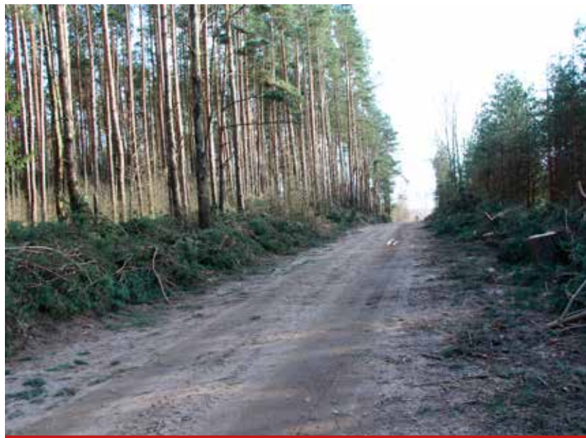
Wycinka drzew pod przebudowę drogi Pomigacze – Lubejki.

dżetu państwa w ramach Programu Rozwoju Gminnej i Powiatowej Infrastruktury Drogowej. We wrześniu 2017 r. gmina złożyła wniosek o dofinansowanie, który przeszedł pozytywną weryfikację i dzięki temu można liczyć na wsparcie finansowe w wysokości 1.925.700 zł. Jest to kolejny wniosek z tego programu, który otrzymał dofinansowanie. W 2017 r. w ramach PRGiPID gmina przebudowała drogę Borowskie Cibory – Bojary.