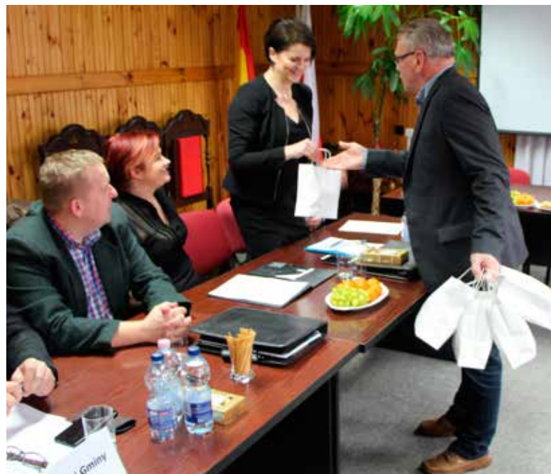
Miłym akcentem były życzenia i drobne upominki z okazji Międzynarodowego Dnia Kobiet.

Pieniądże na drogi były także najważniejszym punktem XXXI sesji Rady Gminy, która miała miejsce 19 lutego 2018 r. 25 tys. zł przeznaczono na opracowanie dokumentacji przebudowy z rozbudową drogi powiatowej Nr 1555B Dołki, kolejne 30 tys. zł na opracowanie dokumentacji przebudowy z rozbudową drogi powiatowej Nr 1501 w Zalesianach. W obydwu przypadkach drugie tyle dołoży powiat, gdyż inwestycja będzie realizowana wspólnie z Powiatowym Zarządem Dróg w Białymstoku. Ale to nie koniec dobrych informacji dotyczących poprawy stanu dróg na terenie gminy, bowiem w Pomigaczach „poleje” się asfalt. Jednogłośnie decyzją Rada