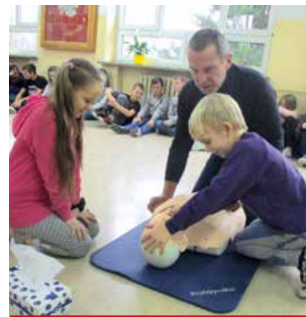
Dzięki warsztatom z programu „Bezpieczna+” uczniowie wiedzą jak udzielić pierwszej pomocy.

Od 1 września do 31 grudnia 2017 r. podstawówek realizowała rządowy program wspomagania w latach 2015-2018 organów prowadzących szkoły w zapewnieniu bezpiecznych warunków nauki, wychowania i opieki w szkołach „Bezpieczna+”. Uczniowie wzięli udział w wielu ciekawych zajęciach. Na lekcji z policjantem przypomnieli sobie podstawowe zasady zachowania się na drodze, podczas spotkania z nieznanym, czy ze zwierzętami. Po warsztatach „Mały Ratownik” wiedzą już, jak udzielić pierwszej pomocy przedmedycznej, a pracownicy Państwowej Straży Pożarnej uświadomili im, co zrobić w razie pożaru. Wspólnie z nauczycielami i rodzicami zapoznawali się z bezpiecznym korzystaniem z cyberprzestrzeni. Były też konkursy plastyczne, quiz i – oczywiście – nagrody.