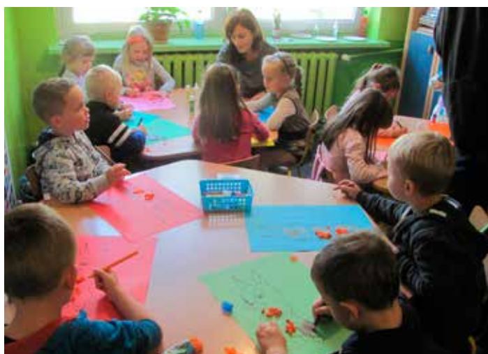
Kreatywne zajęcia to jest to, co przedszkolaki lubią najbardziej.

Zajęcia muzyczno-ruchowe, korekcyjne, dramaterapii i bajkoterapii, warsztaty przedsiębiorczości – z tych i wielu innych zajęć dodatkowych będą korzystać przedszkolaki z „Bajeczki”. Wszystko w ramach projektu pn. „Kreatywny świat przedszkolaka” realizowanego przez Niepubliczną Szkołę Podstawową z oddziałami przedszkolnymi w Niewodnicy Kościelnej dofinansowanego z Funduszy Europejskich. Jest to szansa na wyrównanie braków edukacyjnych, podniesienie kompetencji matematyczno-przyrodniczych oraz naukę języków obcych: angielskiego, niemieckiego i rosyjskiego. Przewidziane jest nie tylko nauczanie, dzieciaki spędzą kreatywnie czas rozwijając zdolności plastyczne, muzyczne i teatralne. Nauczyciele również skorzystają, bo dziesięciu z nich podniesie swoje kompetencje zawodowe