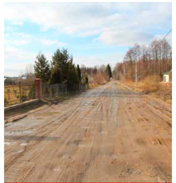
Stan obecny ul. Kościelnej w Niewodnicy Kościelnej na odcinku od cmentarza w kierunku Czaplina.

Obecnie Zarząd Dróg Powiatowych w Białymstoku dokonuje analizy złożonych ofert w postępowaniu przetargowym.