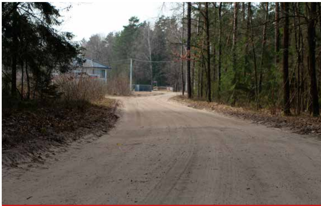
Ulica Trakt Napoleoński w Niewodnicy Kościelnej.

Od kwietnia po ustabilizowaniu gruntu, przy sprzyjających warunkach pogodowych planowane jest rozpoczęcie proflowania nawierzchni z wykorzystaniem równiarki drogowej. Do naprawy dróg gruntowych kupiliśmy 3 tys. ton