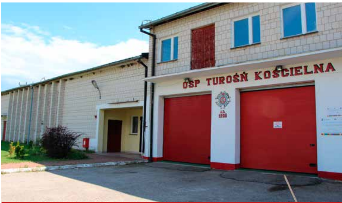
Remont budynku remizy w Turośni Kościelnej ma trwać do końca lipca br.